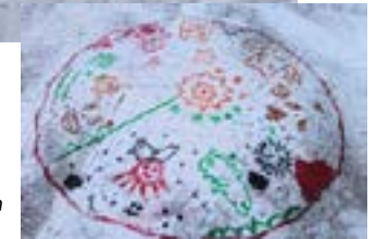
Kuvat on otettu tammikuun Talvileiriltä.